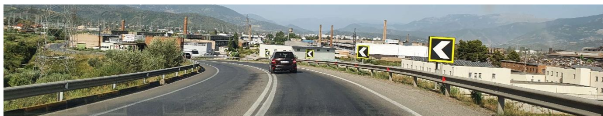
Металлургический завод KURUM в Эльбасане 01.08.2021, достопримечательность немного напоминает Хюттенталь в Зигене много лет назад.