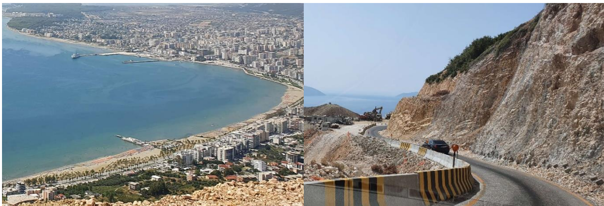
Вид на Флору с новой объездной дороги, частично пока еще однополосной, # 01.08.2021

Здесь имеются светофоры, оснащенные сверху донизу LED-лентами. В Тиране городской бесплатный WLAN, а также удивительный строительный бум, по крайней мере, в городах Влёра и Тирана. Около 14 дней назад была построена и уже открыта для транспорта объездная дорога длиной 28,7 км от Левана (округ Фиер) до Влёры по и через горные хребты. Два коротких и «трудных» участка дороги по-прежнему однополосные.