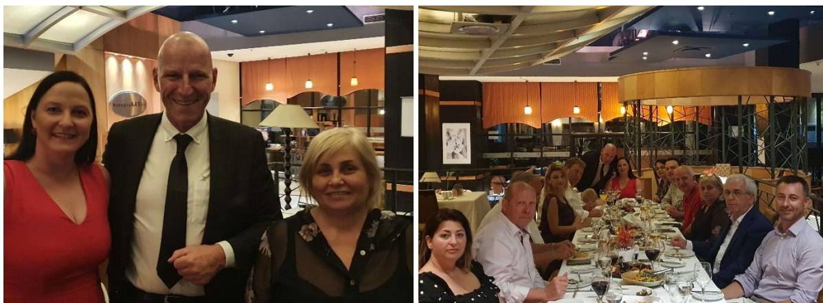
С министром Милвой Экономии и остальными

Во время первого визита в академию около 4 недель назад Цоц уже согласился принять участие в международной конференции TNT2021 (Тенденции в нанотехнологиях), а также порекомендовать принять участие высококвалифицированным экспертам из сферы промышленности, исследований и преподавания. Первый, кто согласился, был ответственный за создание завода по экстракции каучука одуванчика в Ольпе в ZTC.